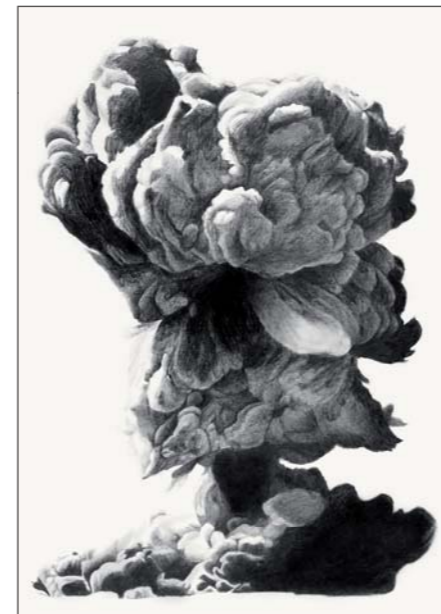
« Série Atomique » • 2016 • 42 x 29,7 cm • crayon sur papier

Le territoire est le point de départ de ses projets dont la pratique se veut située, impliquée dans des processus de création pour rendre tangible par l'objet et le matériau les relations avec les différents acteurs de la fabrication de ses pièces.