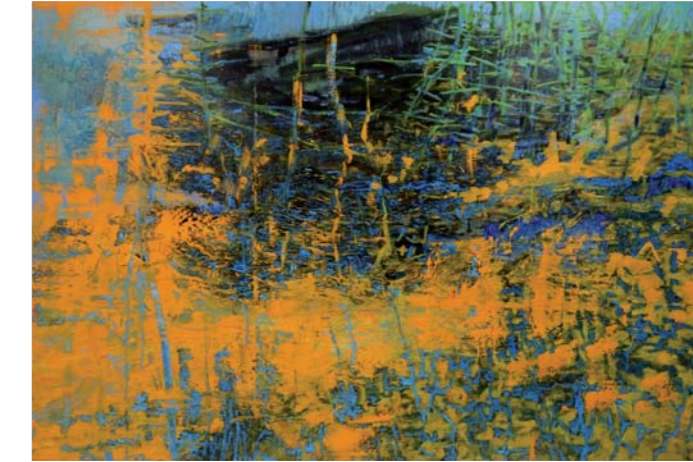
« 95-18-2 » • 2018 • 195 x 295 cm • Huile sur toile