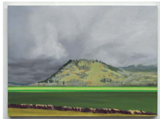
« Color Fields Oregon » • 2018 • 54 x 73 cm • Peinture à l'huile

Un livre, tout en poésie Songe d'hiver à Versailles (ed. du Palais) accompagne ces photos silencieuses.