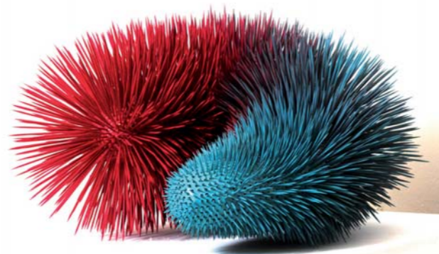
« Indefense » • 2016 • 70 x 60 x 62 cm • Céramique et bois

Cristobal Ochoa aa-e.org/fr/artiste/ochoa-cristobal cristobalo19@gmail.com @cristobal8a