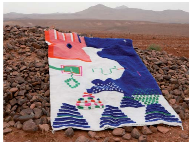
« Tinzaline » • Maroc, 2019 • 184 x 255 cm • Tissage et nouage en laine

Indefense fait référence à une faune et une flore marines imaginaires qui reviennent fréquemment dans son travail. Elle rayonne de ses couleurs vibrantes et changeantes et nous invite à des voyages oniriques.