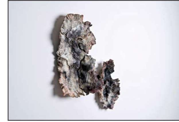
« Lichens » • 2016 • 30 x 40 cm • Céramique et oxydes métalliques