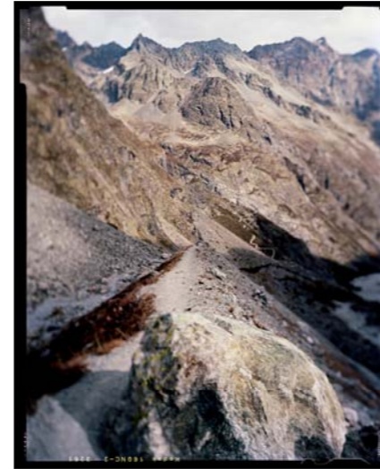
« Bas-reliefs, Une question d'épreuves » • 2010 • 74 x 60 cm