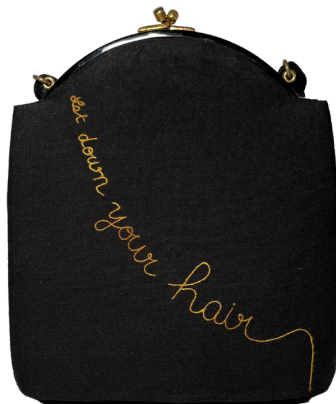
Let Down Your Hair, 2025 Sac à main vintage, tissu coton, fil à broder 20 x 21 x 5 cm

Ce médium, rapidement exploré dans ses limites, l'incite à envisager des formes plus ambitieuses. Elle intègre alors un Master of Fine Arts à la San Jose State University, en Californie. Les grandes installations réalisées à ce moment-là constituent les prémices de son travail actuel, associant broderie - geste doux hérité de sa mère et de sa grand-mère -, techniques mixtes et thématiques féministes, bien que l'artiste n'apprécie guère ce dernier terme.