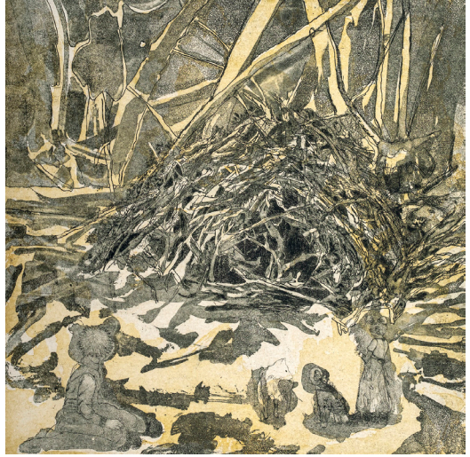
Fantômes , 2021 Eau forte et aquatinte sur cuivre, chine appliqué 30 x 30 cm © Luc Médrinal

Elle fabrique elle-même certains de ses papiers à partir de fibres végétales et explore les pigments extraits des plantes, acceptant les aléas du climat et de la matière comme partie intégrante du processus créatif. Cette pratique expérimentale, fondée sur le lâcher-prise, transforme son rapport à l'œuvre, qui devient plus lente, plus physique, parfois précaire, susceptible de ne pas advenir exactement telle qu'imaginée.