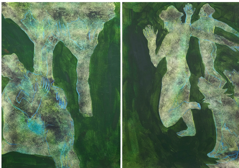
La dignité humaine (mon loup). La dignité humaine (danse tribale), 2025 Crayon, aquarelle et acrylique sur papier 42 x 29.7 cm chaque

Imprégnés de douceur, les corps portent le rêve d'une présence tendre au monde, que l'artiste offre ici à partager.