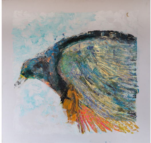
Dénichée , 2023 Acrylique et pastel sur toile 120 x 110 cm

Ces formes de petite taille naissent de matériaux collectés au fil de ses balades : crânes, pinces de crabe, plumes, terre glaise... Ces éléments deviennent la matière première d'assemblages sensibles, parfois rehaussés de couleur, où la récupération se transforme en geste poétique. Cette pratique lui offre un ailleurs, un déplacement nécessaire lorsqu'un tableau résiste, avant le retour devant sa toile.